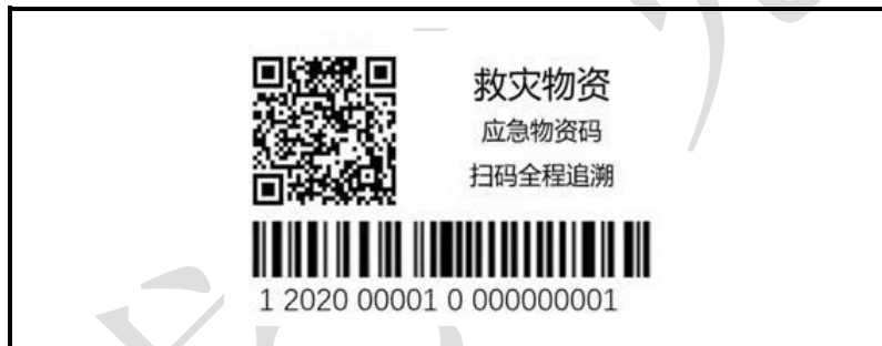
示例 2 产品标志耐久性标签